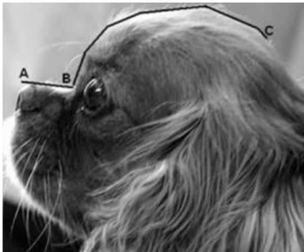
Abb. 2 Verhältnis Schnauzen-/Schädel­länge (aus Packer, 2014: S. 18)

Schnauzenlänge (Nasenspiegel bis Stopp) in mm X 100 = Schädel­länge (Stopp bis Kante Hinterkopf) in mm